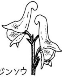
アズマレイジンソウ